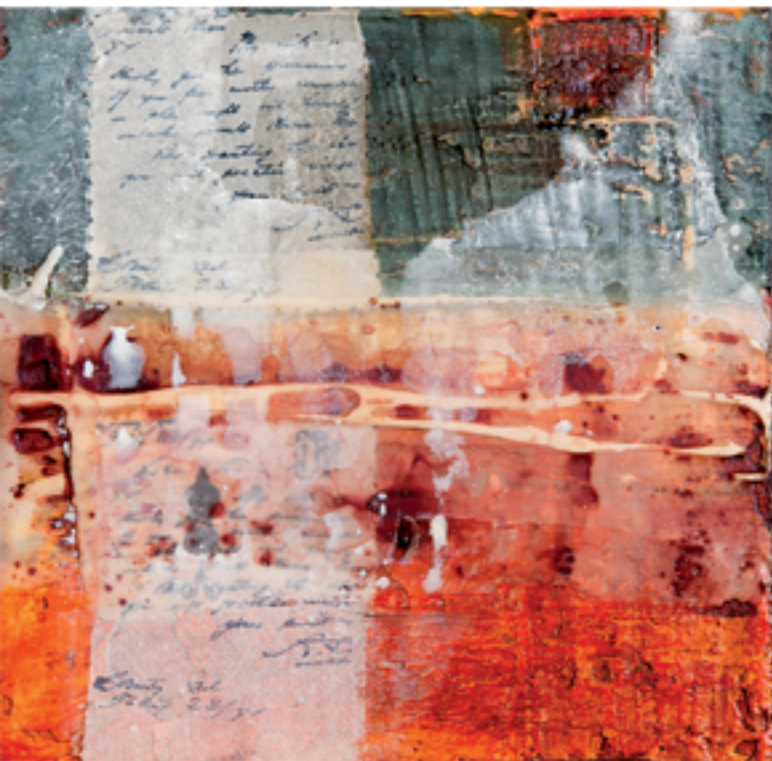
Sound of desert III Acryl/Mischtechnik auf Holz/Alu 40 x 40 cm | 2013