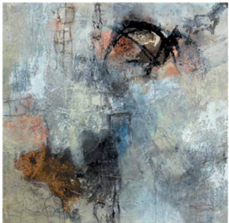
Sorpresa III Acryl/Mischtechnik | 60 x 60 cm | 2013