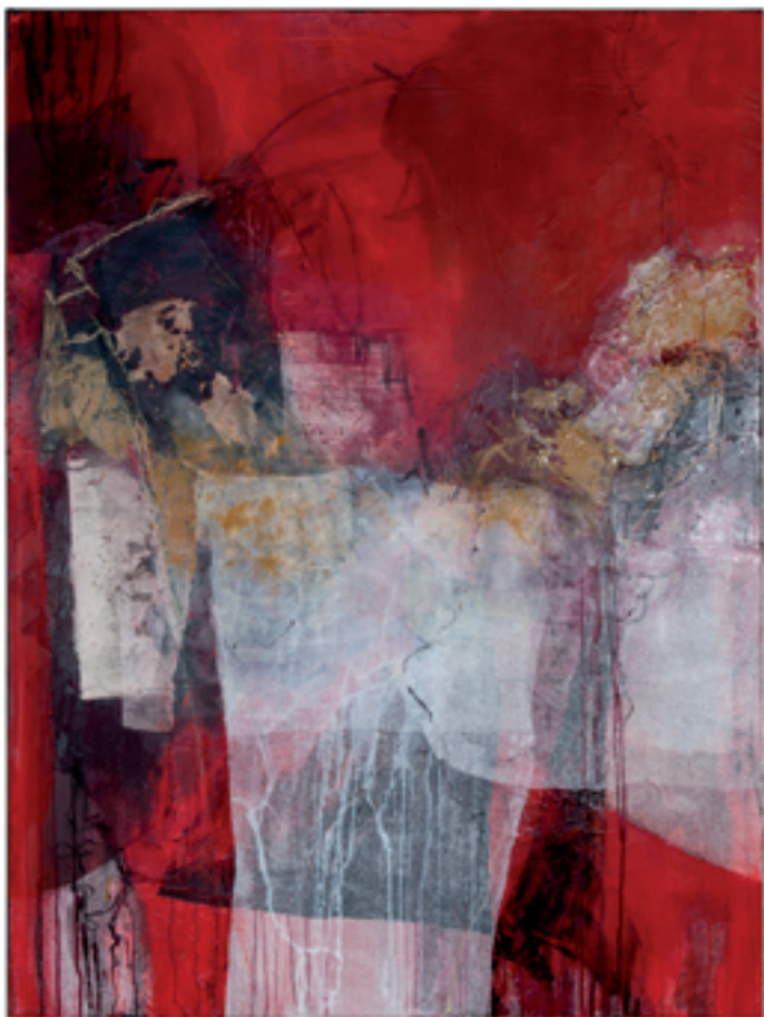
Varietà I Acryl/Mischtechnik | 90 x 120 cm | 2013