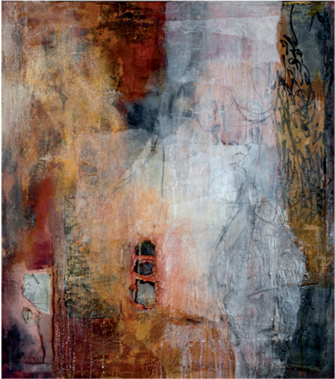
Farbschwingung II Acryl/Mischtechnik | 90 x 100 cm | 2013