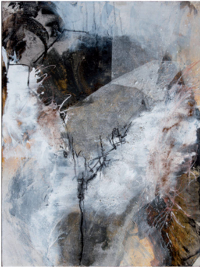
Naturwelten Acryl/Mischtechnik | 90 x 120 cm | 2013