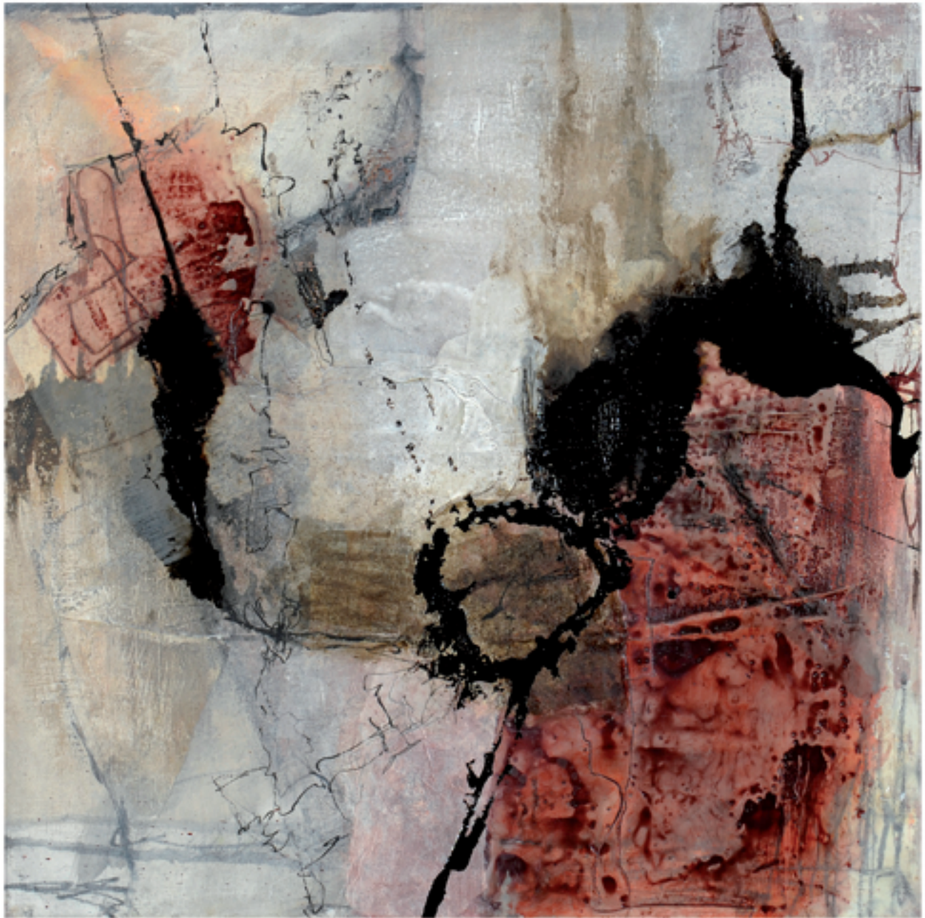
Curiosità Acryl/Mischtechnik | 60 x 60 | 2013