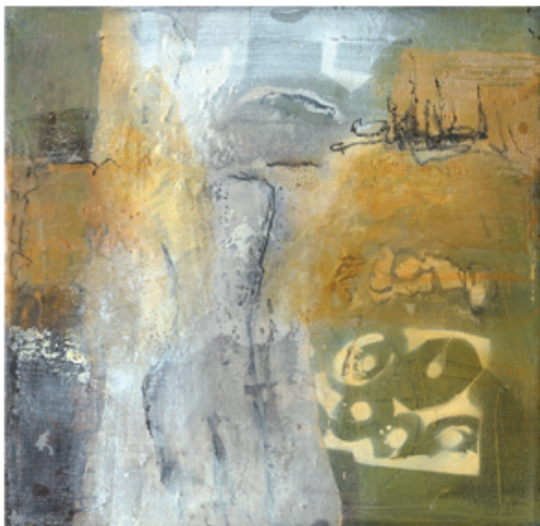
Passegiata III Acryl/Mischtechnik | 40 x 40 cm | 2013