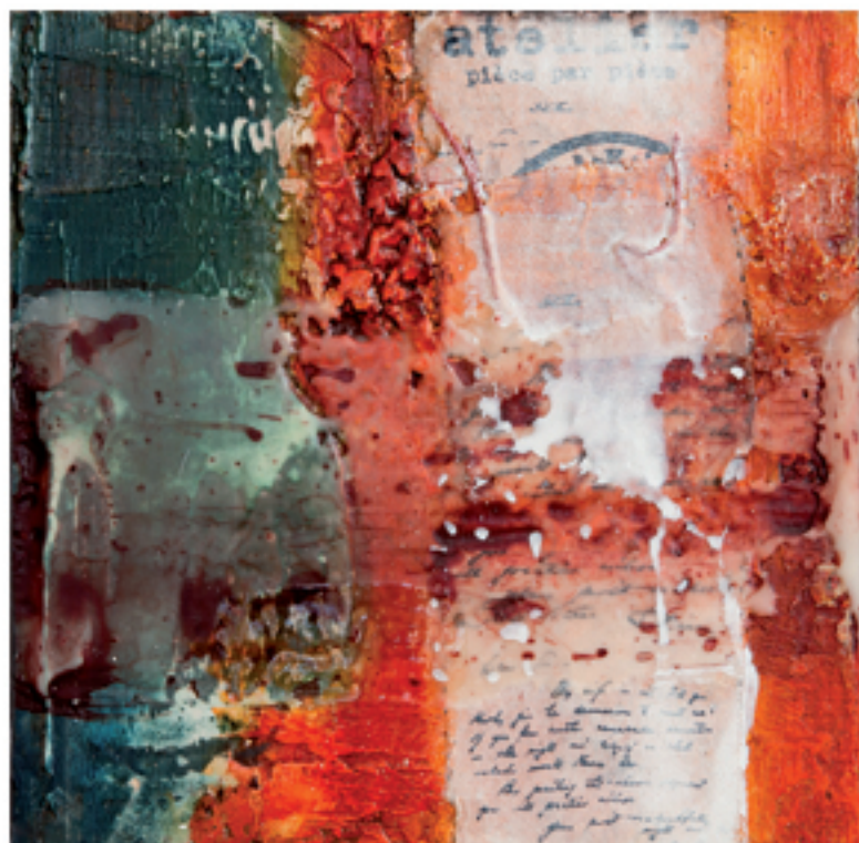
Sound of desert II Acryl/Mischtechnik auf Holz/Alu 40 x 40 cm | 2013