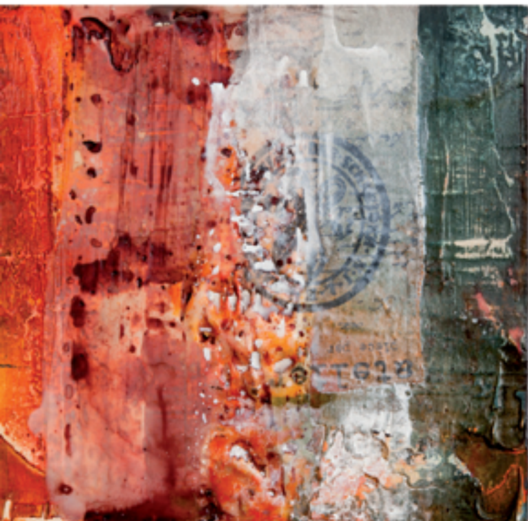
Sound of desert I Acryl/Mischtechnik auf Holz/Alu 40 x 40 cm | 2013