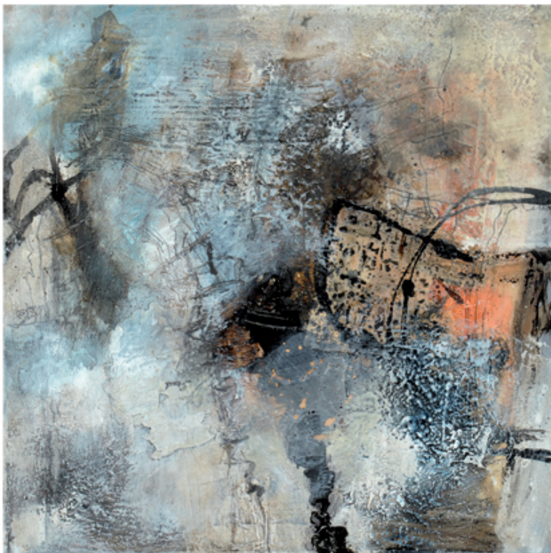
Sorpresa I Acryl/Mischtechnik | 60 x 60 cm | 2013