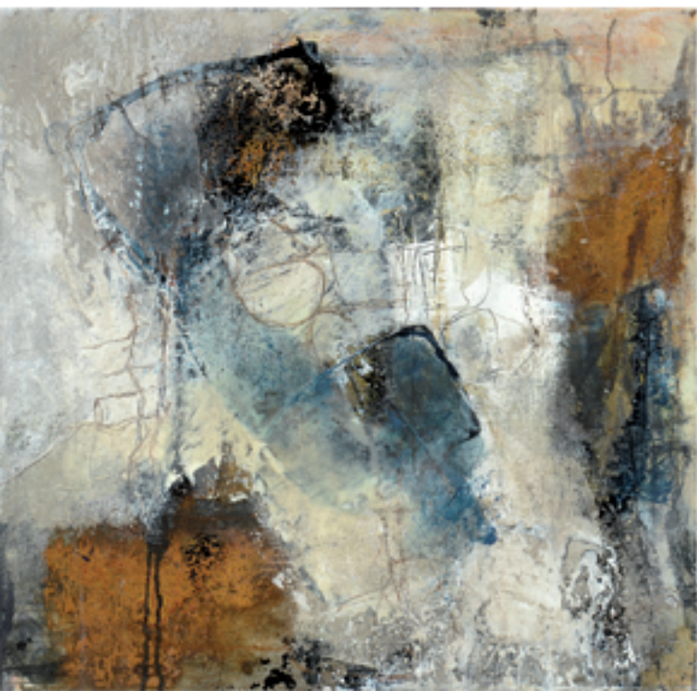
Sorpresa II Acryl/Mischtechnik | 60 x 60 cm | 2013