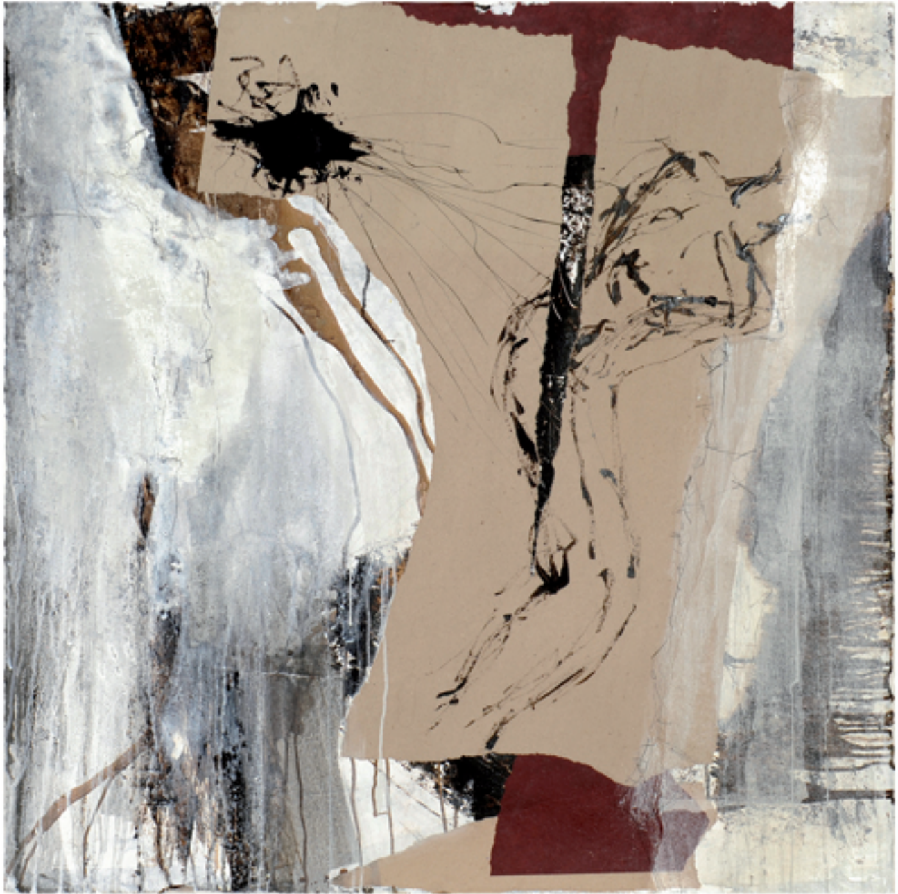
Befreiung Acryl/Mischtechnik auf Karton | 100 x 100 | 2013