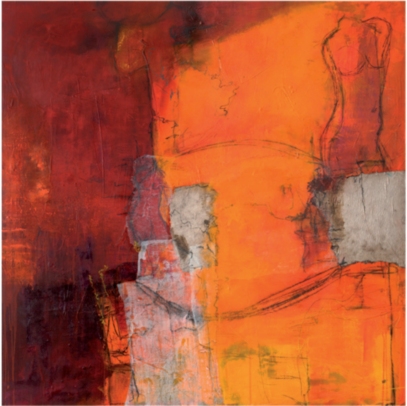
Serenata Acryl/Mischtechnik | 120 x 120 | 2013