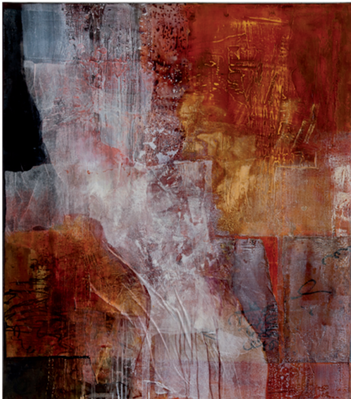
Farbschwingung I Acryl/Mischtechnik | 90 x 100 cm | 2013