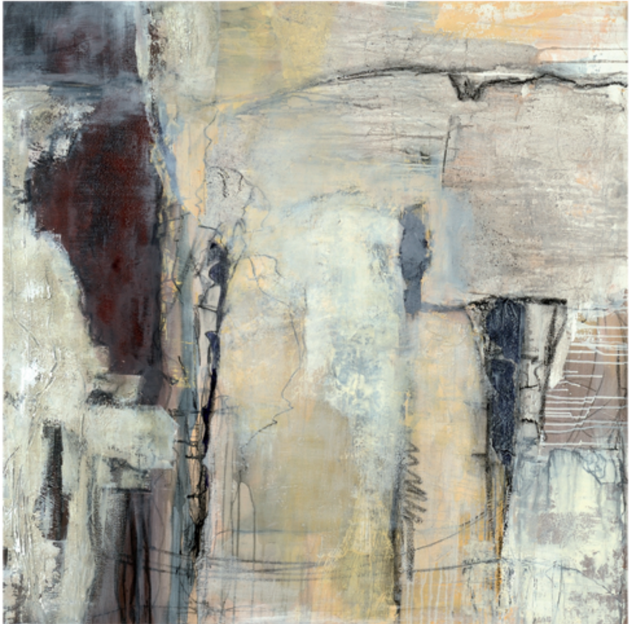
Unterschiedliche Einheit Acryl/Mischtechnik | 130 x 130 | 2013