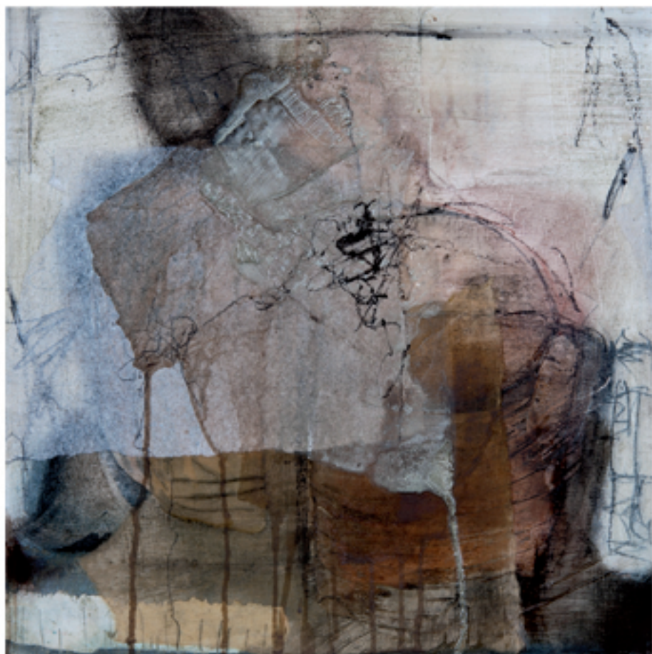
Havanna I Acryl/Mischtechnik auf Holz | 40 x 40 cm | 2013