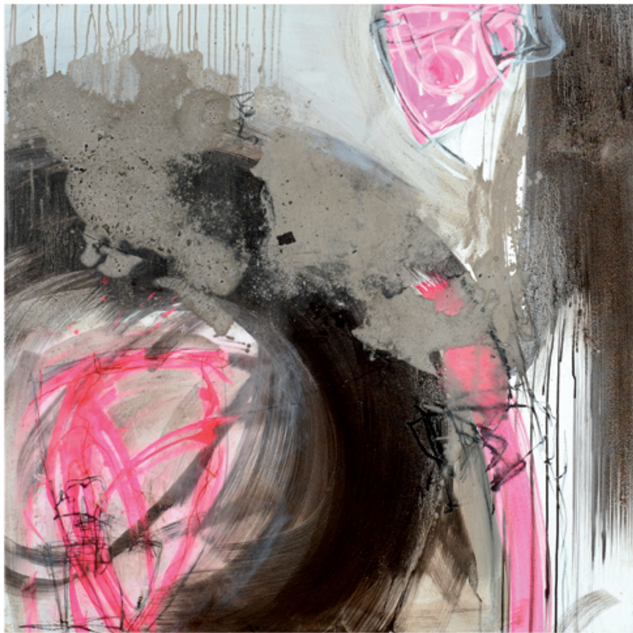
Da durch Acryl/Mischtechnik | 120 x 120 | 2013