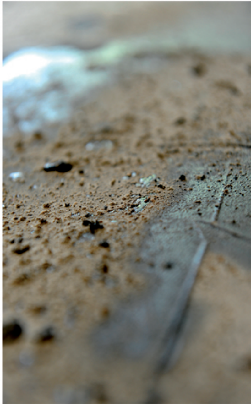
Ausschnitt aus dem Bild ‚Da durch‘ (S. 45)