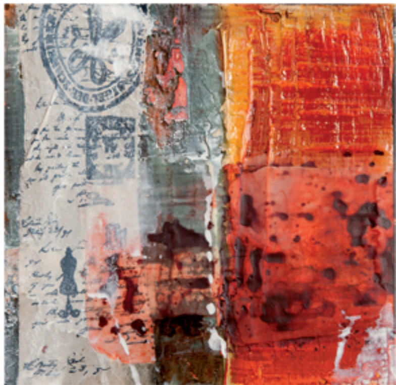
Sound of desert IV Acryl/Mischtechnik auf Holz/Alu 40 x 40 cm | 2013