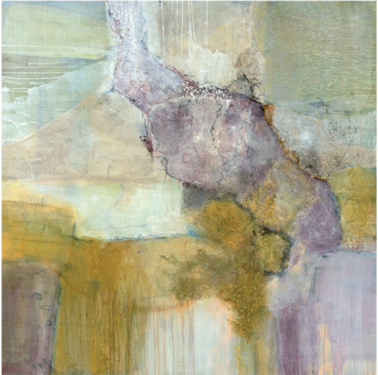
Verwandlung Acryl/Mischtechnik | 130 x 130 | 2013