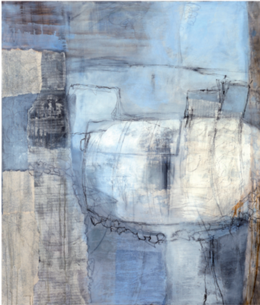
Tschutschu Acryl/Mischtechnik | 130 x 150 cm | 2013