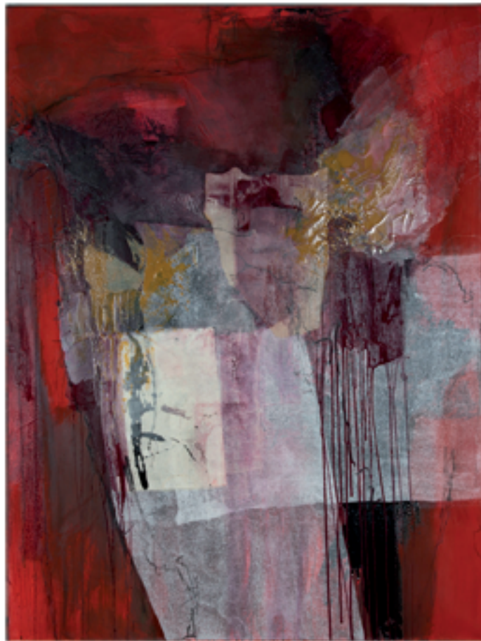
Varietà II Acryl/Mischtechnik | 90 x 120 cm | 2013