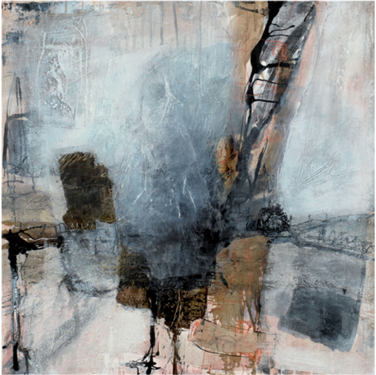
Mi piace Acryl/Mischtechnik | 80 x 80 | 2013