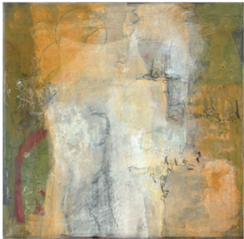
Passegiata II Acryl/Mischtechnik | 40 x 40 cm | 2013