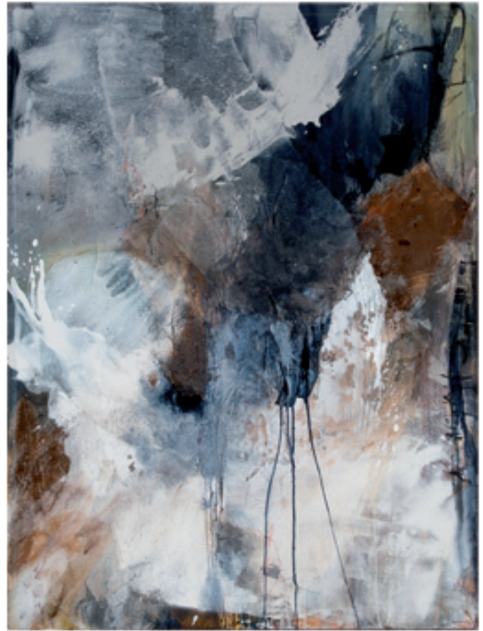
Naturspiele Acryl/Mischtechnik | 90 x 120 cm | 2013