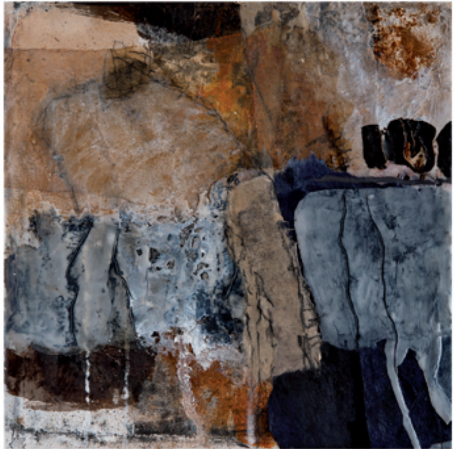
Wege gehen Acryl/Mischtechnik | 30 x 30 cm | 2013

< Lichtpunkt Acryl/Mischtechnik 30 x 30 2013