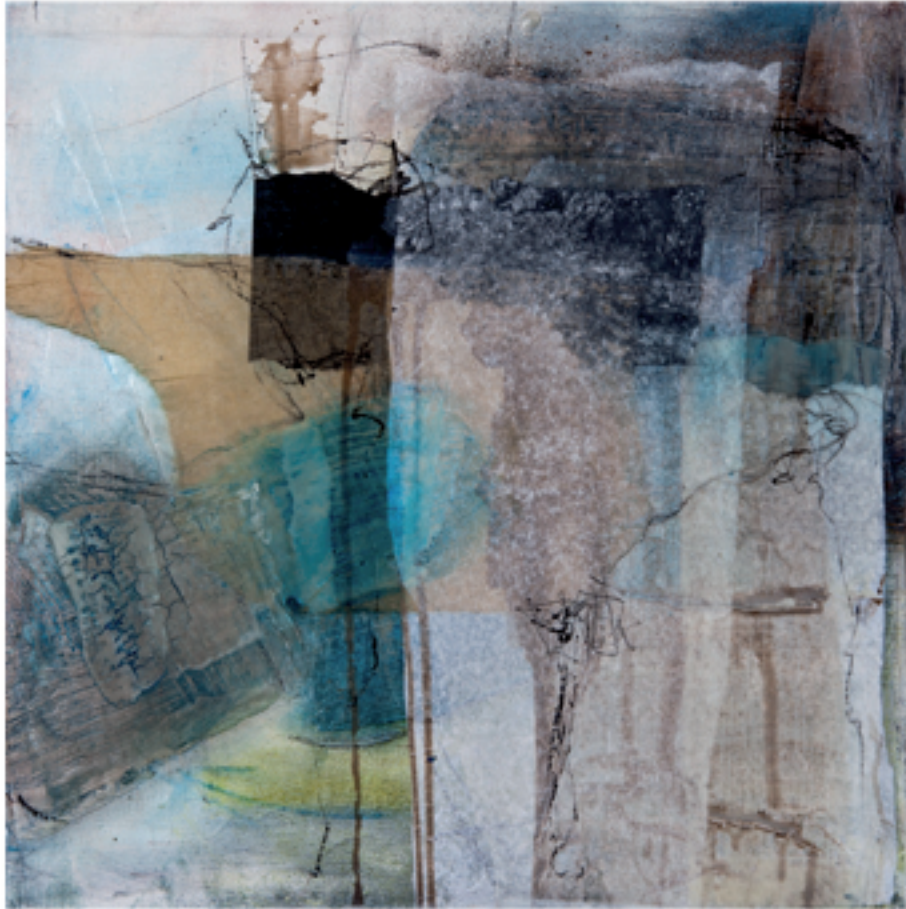
Havanna II Acryl/Mischtechnik auf Holz | 40 x 40 cm | 2013