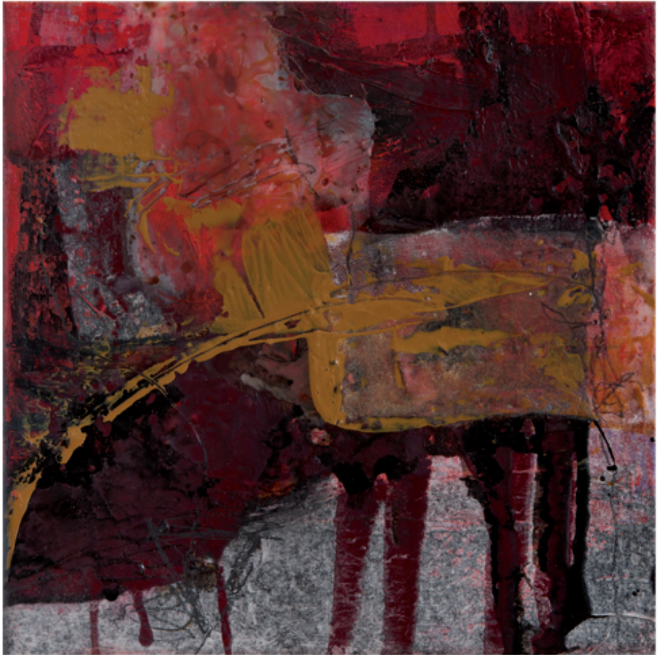
Fuego Acryl/Mischtechnik | 30 x 30 | 2013